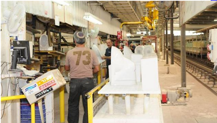
עובדי מפעל (תמונת ארכיון)

מפעיל מכונה - דרוש למפעל של חברת וינר בוריס בקרית-גת. העבודה במשרה מלאה, בימים א'-ה', שעות 7:00-16:00. שכר התחלתי: 32 שקל לשעה. תנאים: ארוחות, הסעות מקרית גת ומענקים. דרישות: ניסיון קודם בהפעלת מכונות ועבודה על ריצפת ייצור, עמידה בלוחות זמנים, כישורים טכניים, מגורים באזור, שליטה בסיסית במחשב, נכונות לעבודה מאומצת. יתרון להנדסאים. למידע נוסף לחצו כאן .